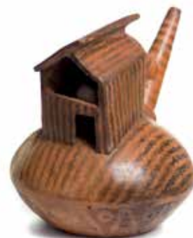
Botella silbadora con forma de edificio cultura Gallinazo – Virú. Perú (Valle de Chicama). 1 – 100 d. c. 14 x 16 x 12 cm Inventario. cpto224