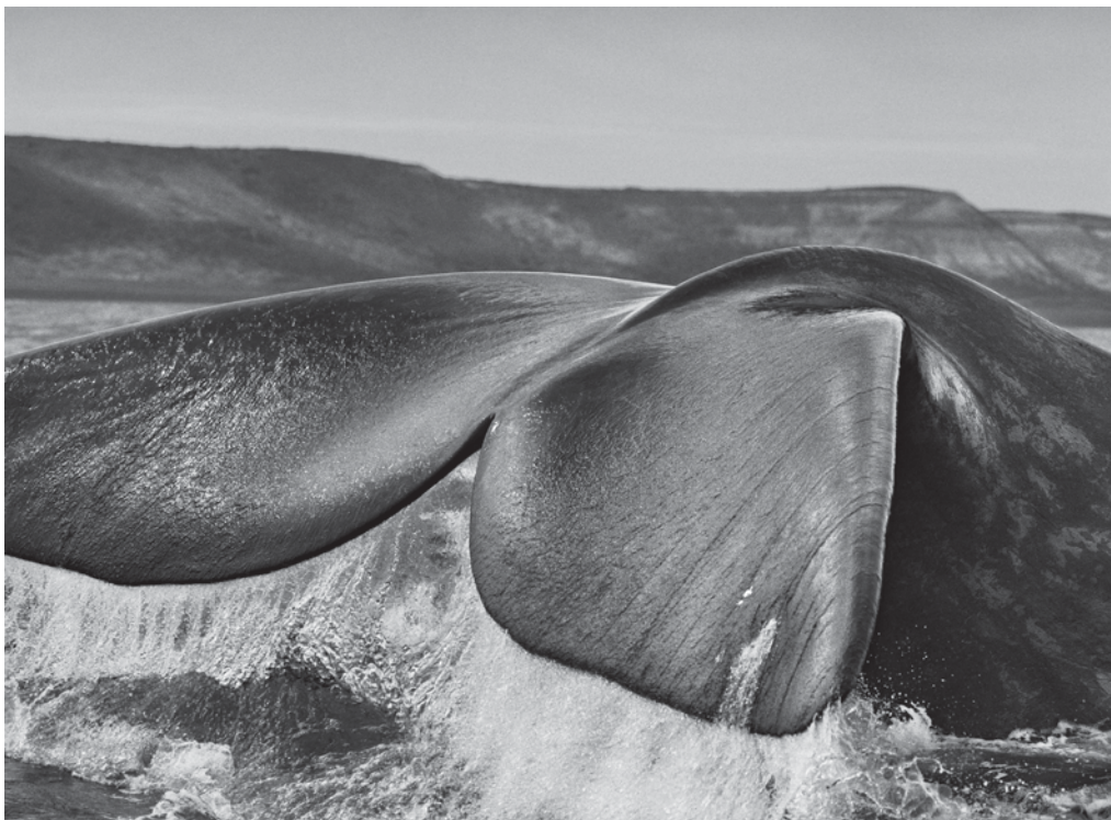
Península de Valdés. Argentina. 2004.

G énesis, que se podrá visitar en Cultural Cordon a partir del 20 de junio, es un mosaico increíble donde la naturaleza se expresa en toda su grandeza. Después de casi tres décadas de reflexión sobre los dramas y tragedias de la humanidad, Sebastião Salgado, Premio Príncipe de Asturias de las Artes en 1998, inició en 2004 un proyecto que constituye, en sus