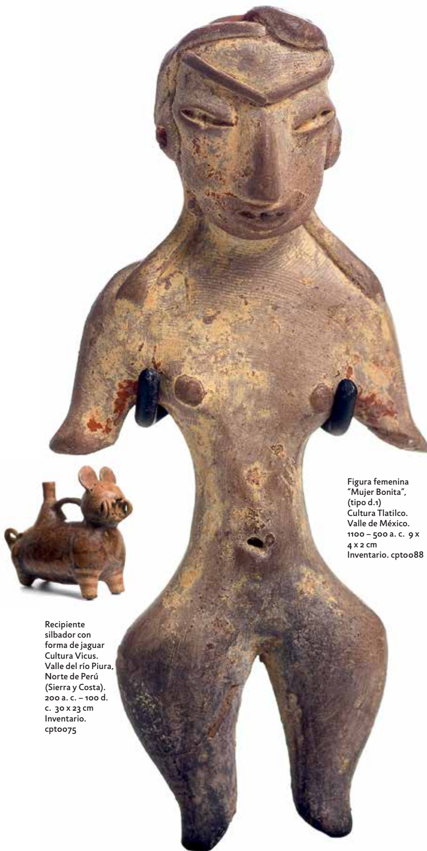
Figura femenina "Mujer Bonita", (tipo d.1) Cultura Tlatilco. Valle de México. 1100 – 500 a. c. 9 x 4 x 2 cm Inventario. cpto088